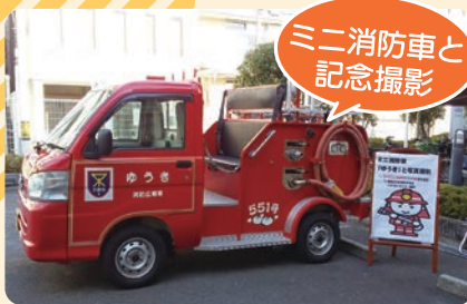
ミニ消防車と 記念撮影

非常食食堂、防災ゲーム、防災対策グッズの展示、おはなし会など、盛りだくさん！来場者にはお楽しみ🎁もありますよ！