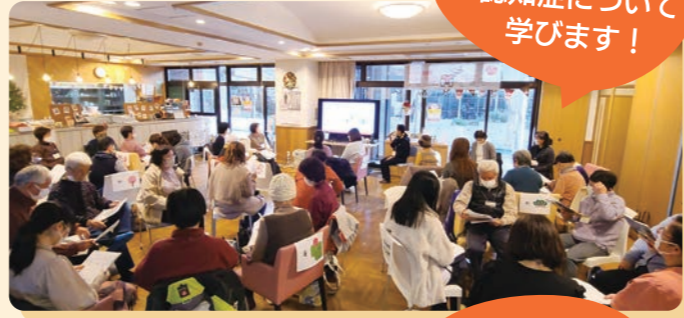
認知症について学びます！