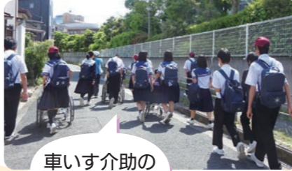
車いす介助の体験中！

スポーツを通じた福祉学習の実施など、さまざまなプログラムの福祉学習に取り組んでいます。福祉学習で使用する物品(ポッチャ・車いすなど)の貸出しも行っていきます。お気軽にご相談ください。