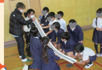
赤と青のボールを転がして、白のボールに近づけることで得点を競い合います。