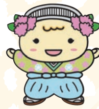
みやこりん 都島区社会福祉協議会マスコットキャラクター